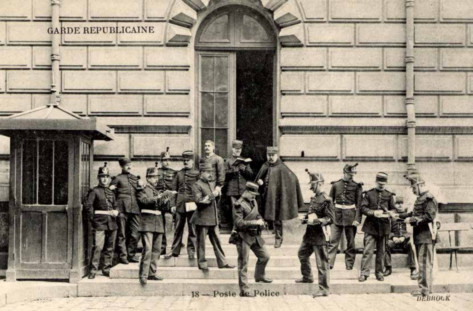
Carte postale de la Belle Époque.