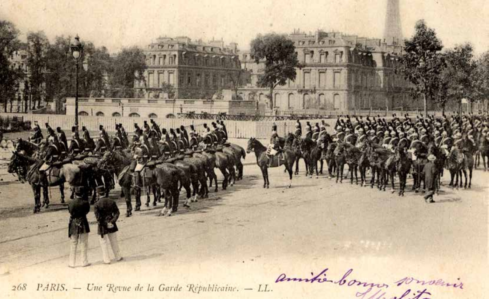
Carte postale de la Belle Époque.

même apparue onze ans plus tôt, au début de l'année 1791. Les attributions de cette nouvelle force parisienne de l'ordre et de l'ordre parisien consistent alors essentiellement en la surveillance des théâtres, des bals avec une rétribution fixée par le préfet de police. Son entretien relève à la fois du gouvernement et de la ville de Paris, particularité budgétaire qui perdure jusqu'en 1937, année à partir de laquelle la troupe relève exclusivement du ministère de la Guerre pour ses finances.