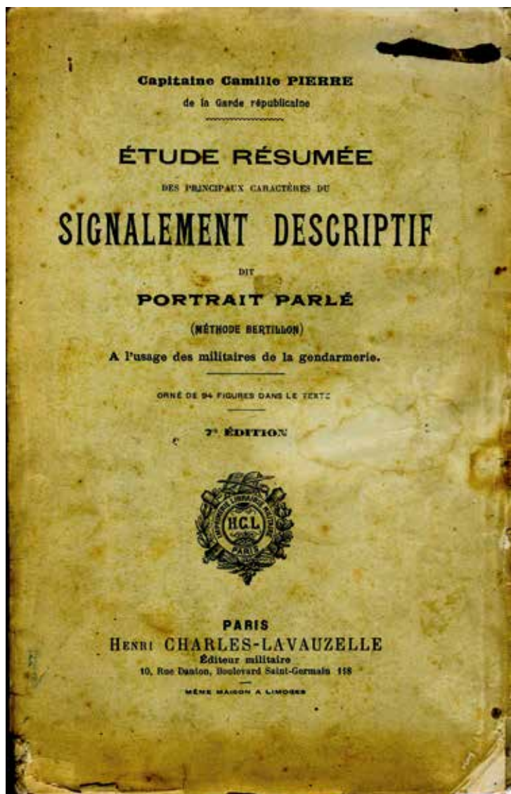
Deuxième édition du Portrait parlé du lieutenant Camille Pierre.