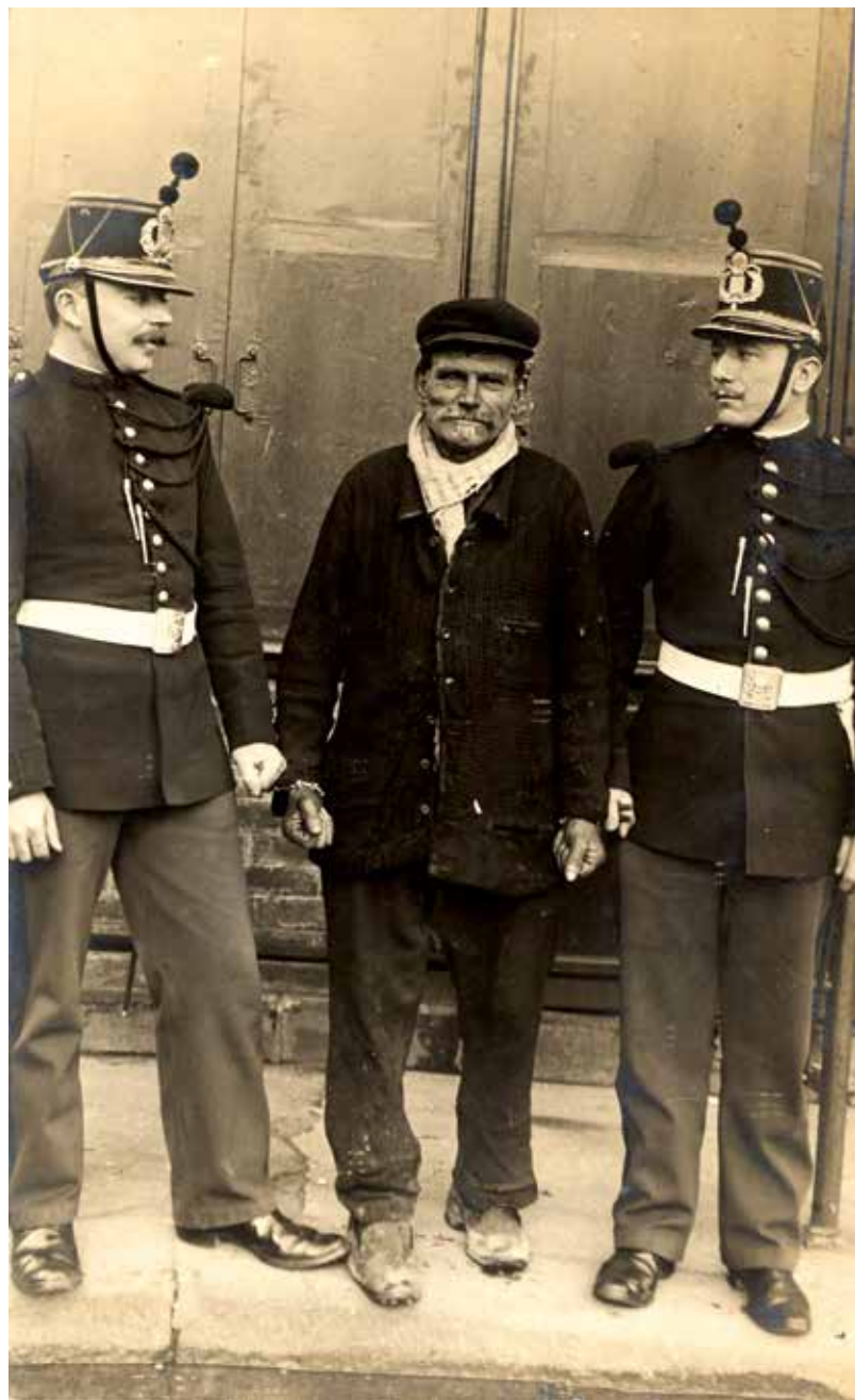
Gardes républicains effectuant une mission de transfèrement à Paris durant la Belle Époque.

doit faire parvenir à l'occasion des événements divers qui intéressent la sûreté de la capitale » (6) . Pour résumer la situation institutionnelle et fonctionnelle de la Garde républicaine, celle-ci apparaît, en définitive, comme la fille aînée de la gendarmerie et la cousine par alliance de la préfecture de police parisienne.